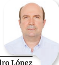
Pedro López Vicario Episcopal Levante

El tiempo de Adviento es un tiempo de anhelo, de esperanza y de alegría. Este tercer domingo de Adviento subraya, precisamente, la ALEGRÍA: “Alegraos siempre en el Señor; os lo repito, alegraos. El Señor está cerca” (Flp 4,4-5) – dice la antífona de entrada de la Misa –.