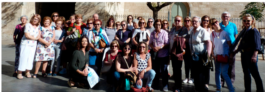
El pasado 5 de octubre, Acción Católica General de Albacete peregrinó a Valencia para celebrar el décimo aniversario de su refundación.