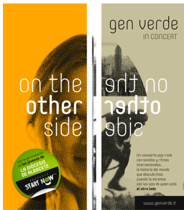
JUEVES 9 de MARZO 19 h. PALACIO DE CONGRESOS DE ALBACETE Donativo 16 € - Entradas en organizadores, Librería BIBLOS - www.genverde.es

“El jueves, día 9, podemos disfrutar del concierto “On the other side” que ofrecerá el Gen Verde y en el que también participarán jóvenes de nuestra diócesis que durante los días previos participarán en el proyecto “Star Now”. Un concierto pop-rock con ritmos y sonidos internacionales... La historia del mundo que descubrimos cuando la miramos