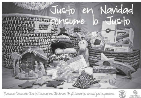
Romero Comercio Justo, Hermanos Jiménez 13, Albacete. www.justoyeco.com

La Red Interdiocesana de Comercio Justo de Cáritas Española trabaja en estrecha relación con las iniciativas que acompañan organizaciones de la red mundial Cáritas en varios países. Artesanías de Bolivia, Bangladesh, Jerusalén y Mauritania, impulsadas por proyectos de economía social de sus Cáritas nacionales, se mezclan con productos de alimentación como infusiones, galletas, café, azúcar de caña integral o cereales, procedentes de países empobrecidos y cultivados o elaborados por grupos productores que intentan salir de situaciones de pobreza por medio del sistema internacional de comercio justo.