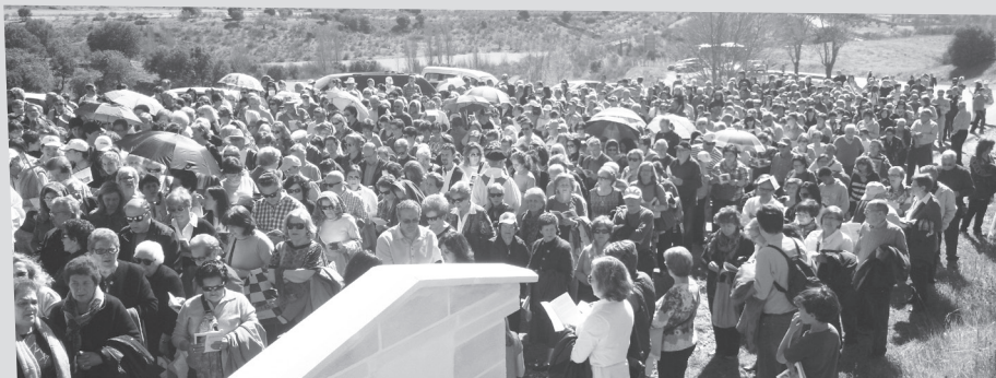
Masiva participación de fieles de toda la diócesis en el tradicional Vía Crucis al Santuario de Cortes. Este año, el sexto, ha tenido como tema central la familia.