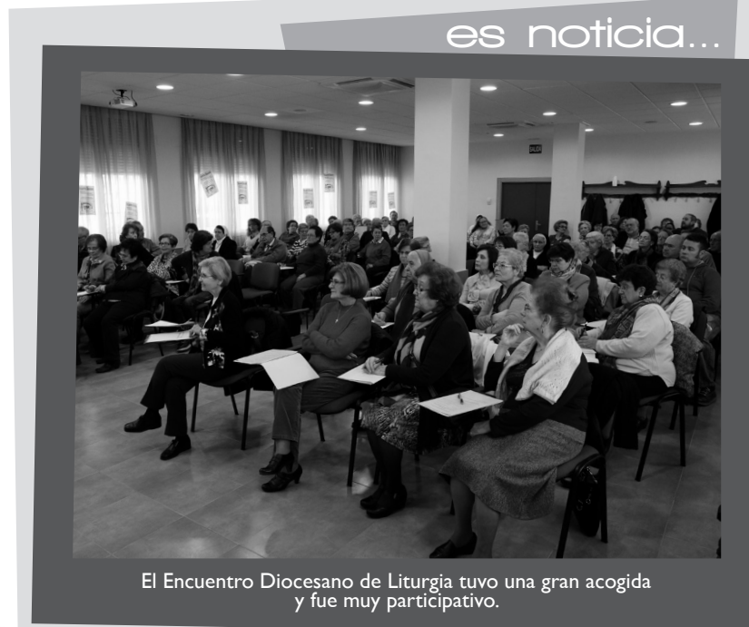
El Encuentro Diocesano de Liturgia tuvo una gran acogida y fue muy participativo.