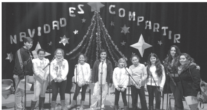
Varios centenares de personas de todas las edades participaron en el Festival de Villancicos que organizaba la Parroquia de Yeste.