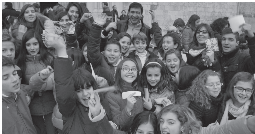
Los niños volvieron a sembrar estrellas por todos los rincones de la diócesis recordando así el nacimiento de Jesús.