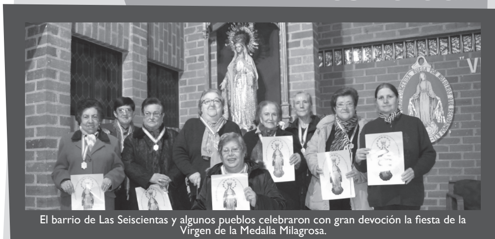
El barrio de Las Seiscientas y algunos pueblos celebraron con gran devoción la fiesta de la Virgen de la Medalla Milagrosa.