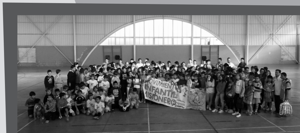
Éxito en Valdeganga de público y participantes en el Encuentro Deportivo de la Solidaridad. Colegios: Severo Ochoa, Ave María, Ntra. Sra. del Rosario Dominicanas, Cedes y las parroquias Espíritu Santo, San Pablo, Nava de Abajo, Peñas de San Pedro y Valdeganga.