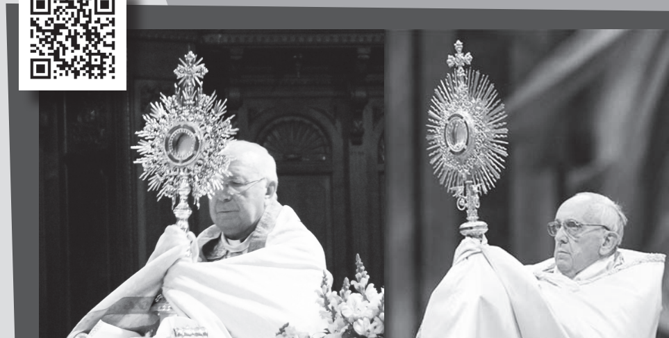
Albacete se unió a la Adoración Eucarística simultánea en todo el mundo, en la fiesta del Corpus Christi, promovida por el Papa Francisco.