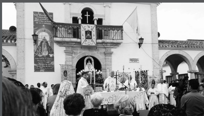
Villarrobledo celebró el XXV Aniversario de la Coronación Canónica de su patrona, Nuestra Señora de la Caridad con una Eucaristía en la explanada de su Santuario.