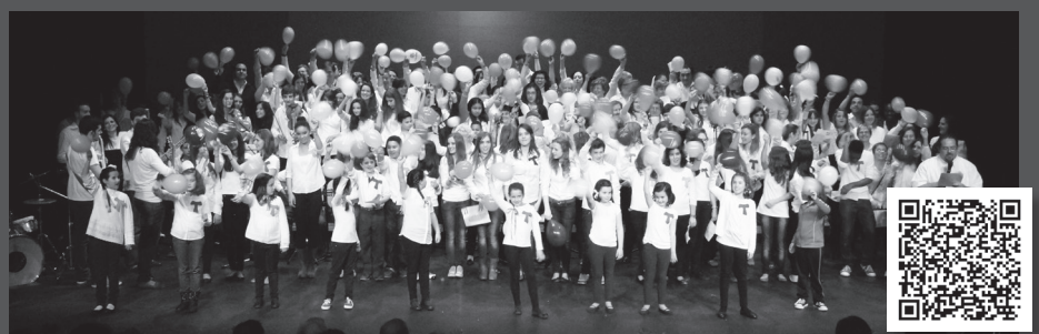
El Encuentro de Coros fue una gran fiesta diocesana donde niños, jóvenes y mayores cantaban Buenas Noticias.