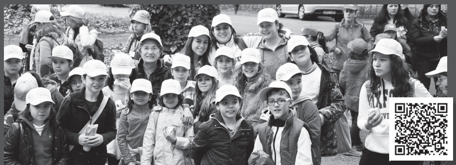
Albacete ha vuelto a vibrar con la misión. Una marea de niños llenaban el Seminario y hacían realidad el lema "Contigo el mundo sonreirá".