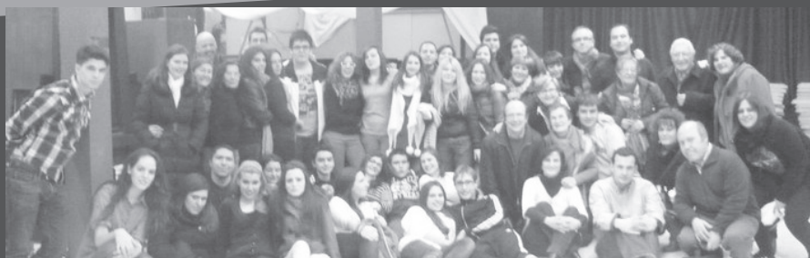
Cáritas joven visitó la Comunidad de Sant'Egidio (Madrid). Un día lleno de emociones donde los jóvenes convivieron, oraron y compartieron la mesa con las personas sin hogar