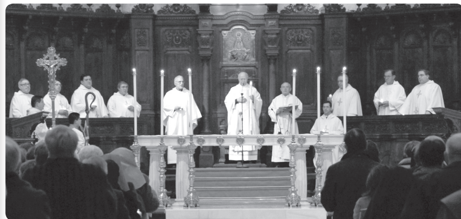
La Vida Consagrada ha celebrado su fiesta con una Eucaristía.