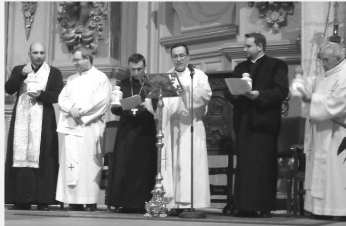
Católicos y ortodoxos oraron juntos por la Unidad de los Cristianos en la parroquia de San Blas de Villarobledo. El encuentro se vivió con mucha paz y alegría al sabernos uno en Cristo.