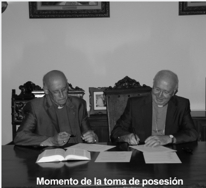
Momento de la toma de posesión