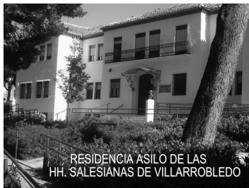
RESIDENCIA ASILO DE LAS HH. SALESIANAS DE VILLARROBLEDO

El día 29 de noviembre se celebra el 50 Aniversario del