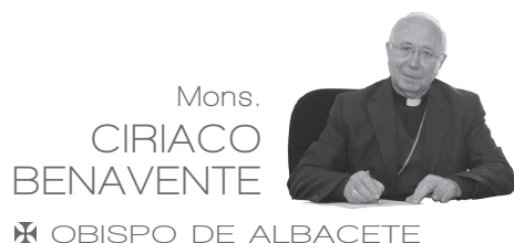
Mons. CIRIACO BENAVENTE