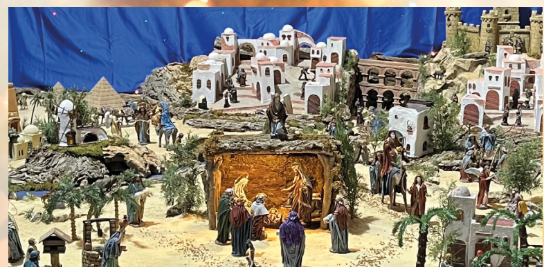
San Isidro. Aguas Nuevas

Camarín de la Encarnación. Horario: de 16h. a 18h. y domingos de 12h. a 13h. En la parroquia de la Asunción encontramos, otro Belén tradicional, que puede visitarse antes y después de la celebración de misa.