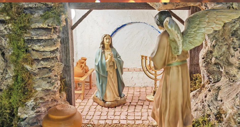
Ntra. Sra. de Fátima. Albacete

San Francisco de Asís realizaba en 1233 el primer pesebre que revivía el nacimiento de Jesús en Belén. Desde esa fecha poner el Belén en el hogar, parroquias, instituciones es uno de los signos de la Navidad. En nuestra diócesis son cientos los preciosos belenes que podemos disfrutar.