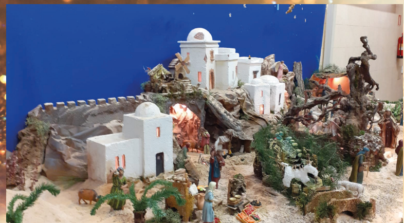
San Vicente de Paúl. Albacete

El Belén de Fátima tiene figuras del arte cristiano de Olot de 1950. Estará abierto de lunes a sábado de 18,30h. a 20h. y los domingos, por la mañana de 11,30h. a 13,30h.