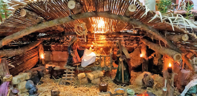
Santa María Magdalena. Ossa de Montiel

Todo rebotante de sencillez y alegría. En un espacio de 10m 2 y montado en tres alturas. Todo hecho con materiales reciclados y plantas naturales. Visitas: lunes a sábados: 12h. a 14h. y de 18h. a 19h. Los domingos de 12h. a 14h.