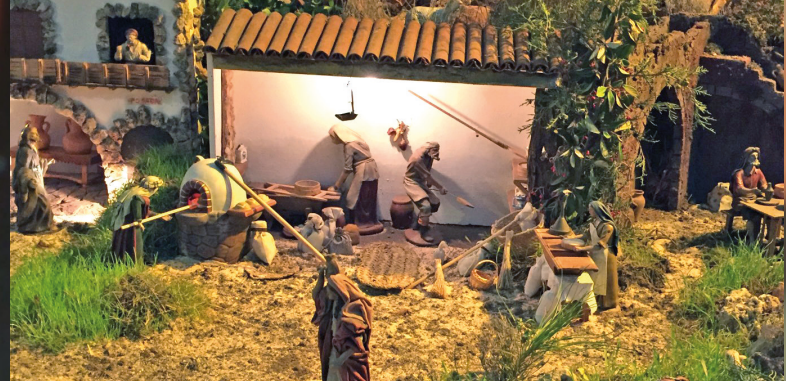
San Sebastián. Munera

Todo rebotante de sencillez y alegría. En un espacio de 10m 2 y montado en tres alturas. Todo hecho con materiales reciclados y plantas naturales. Visitas: lunes a sábados: 12h. a 14h. y de 18h. a 19h. Los domingos de 12h. a 14h.