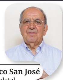
Francisco San José Casa Sacerdotal

el joven cristiano que aspira a un servicio sacerdotal y se prepara en el Seminario;