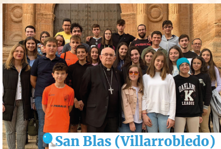
San Blas (Villarrobledo)