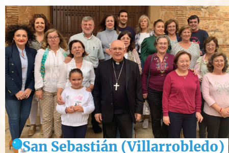
San Sebastián (Villarrobledo)