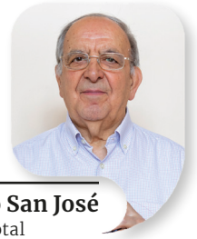
Francisco San José Casa Sacerdotal

Impresiona esta escena del Calvario. Tres crucificados por ser malhechores. Uno de ellos Jesús, suplica el perdón para sus verdugos. ¡Padre, perdónalos porque no saben lo que hacen! Otro, blasfema, habla feamente contra Jesús que comparte su mismo suplicio. Pero hay otro, llamado Dimas que admirado de las palabras de Jesús y escandalizado de Gestas se dirige a éste y le dice: “¿Por qué no te callas? Tú y yo estamos aquí, así, por las fechorías que hemos hecho, pero éste ¿qué mal ha hecho?”. Ninguno. E inmediatamente, con un gesto inteligente y amoroso, dice a Jesús: ¡Acuérdate de mí cuando lleges a tu Reino! Y Jesús le responde: ¡Hoy mismo estarás conmigo en el Paraíso!