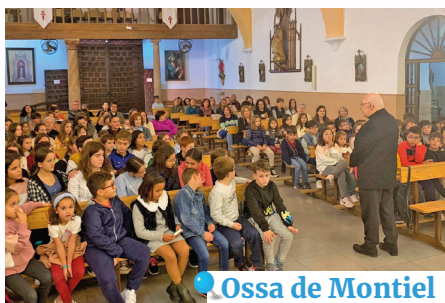
Ossa de Montiel