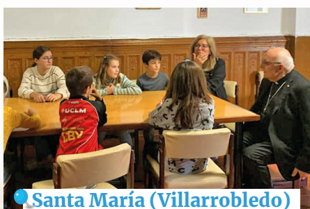
Santa María (Villarrobledo)